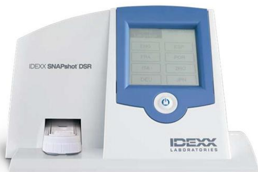
Рідер IDEXX SNAPshot DSR (вміст антибіотиків в молоці)