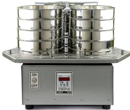
Розсів лабораторний РЛУ-3