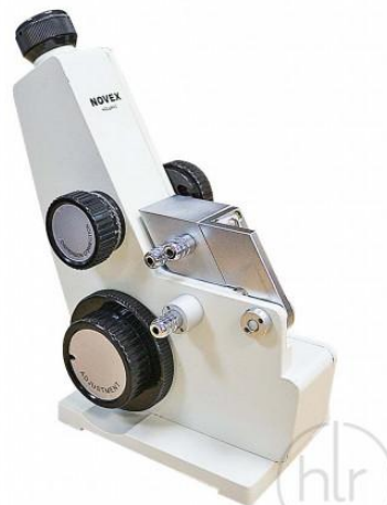
NOVEX Аббе рефрактометр, EUROMEX