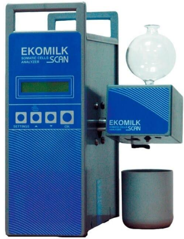
Ультразвуковий аналізатор соматичних клітин в молоці Ekomilk SCAN