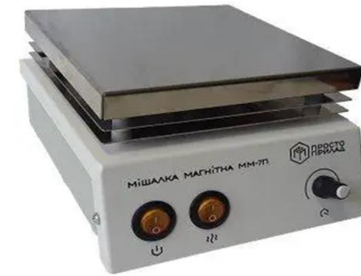
Магнітна мішалка ММ-7П