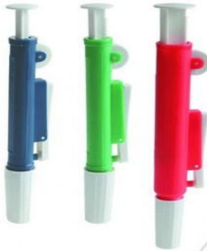
Дозатор для піпеток 2-10 мл