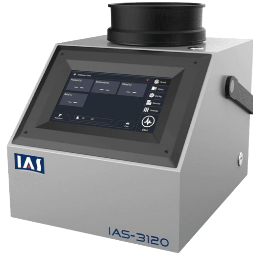
ІЧ спектрометр IAS-3120, виробник Intelligent Analysis Service