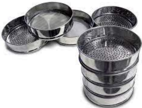
Набір сит (зараженість зерна) СЛ-300