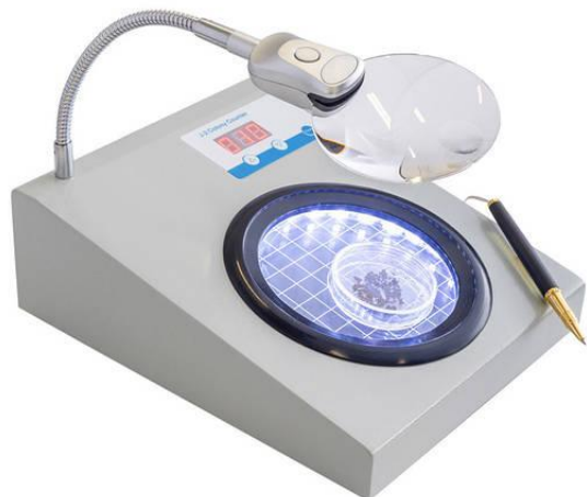
Лічильник колоній ColonyStar