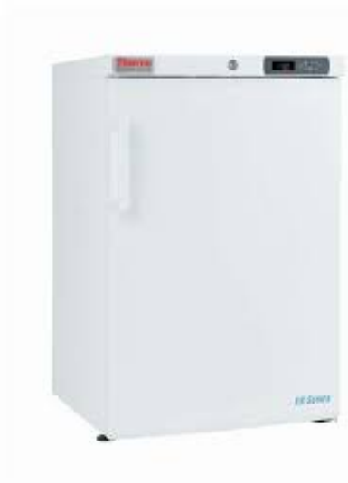
Холодильник лабораторний серії +1...+10С, Thermo Scientific