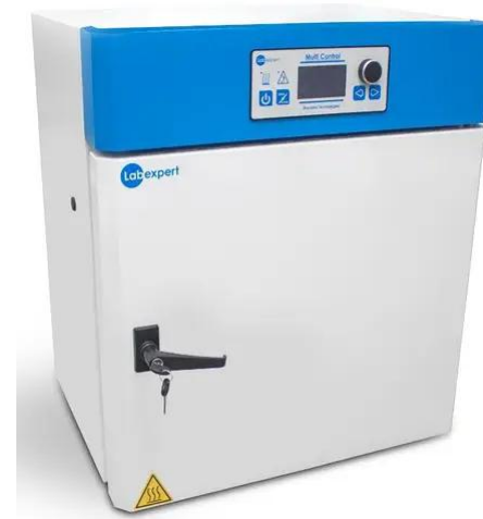
Шафа сушильна LabExpert