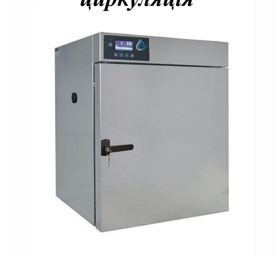
Шафа сухожарові, природ. циркуляція