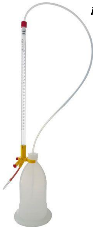
Автоматична бюретка для визначення титрованої кислотності