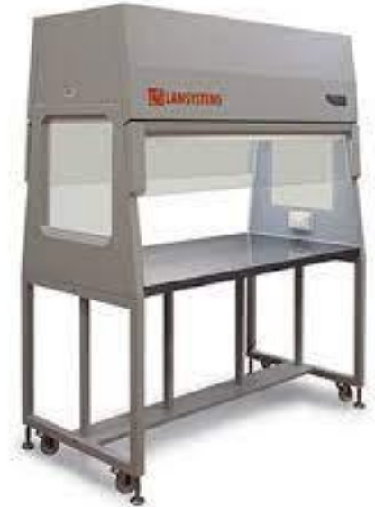
Ламінарний бокс з вертикальним потоком