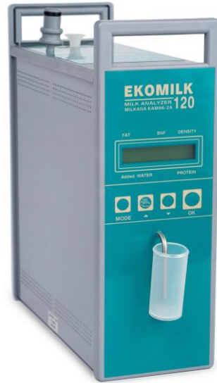
Ультразвуковий аналізатор молока Ekomilk