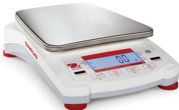
Ваги лабораторні «ОHAUS»